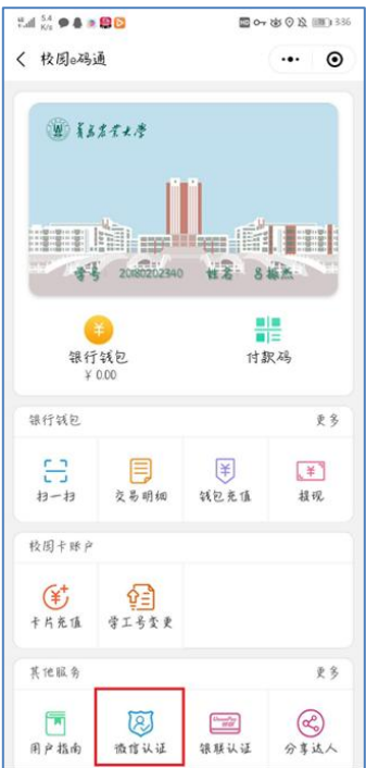
图 7 微信绑定