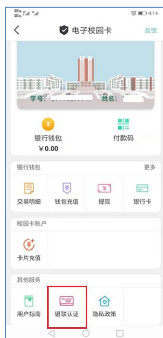
图 11 银联认证

在“今日校园”的 APP 中，选择“校内服务”，点击“电子校园卡”，进入如下界面，点击“银联认证”。