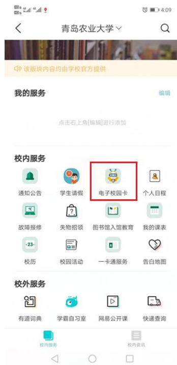
图 2 “今日校园”APP->“电子校园卡”