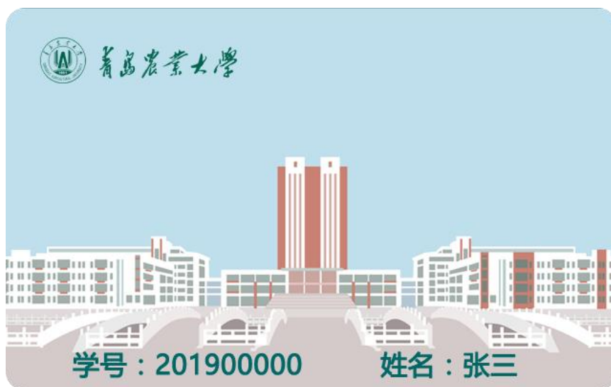
图 1 电子校园卡设计卡样

电子校园卡采用了扁平化设计元素，界面美观、简洁。开通方式采用手机 APP 线上领取，方便广大师生使用。 请广大师生尽快完成电子校园卡领卡及第三方支付关联认证，学校根据疫情防控期间人员追溯的需要已取消餐厅档口个人的移动支付方式。