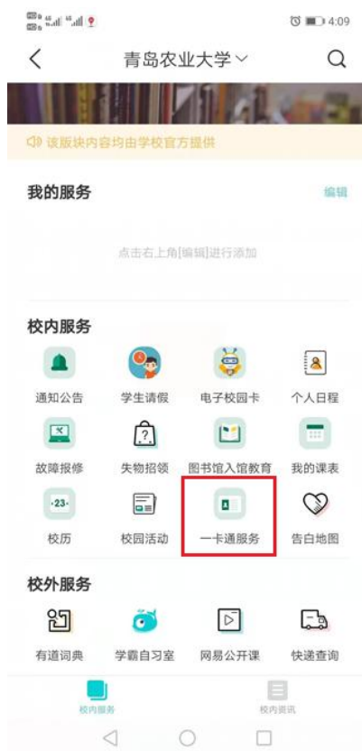
图 12 “今日校园” APP->一卡通服务