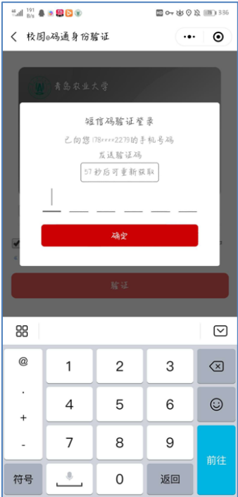
图 6 短信码验证