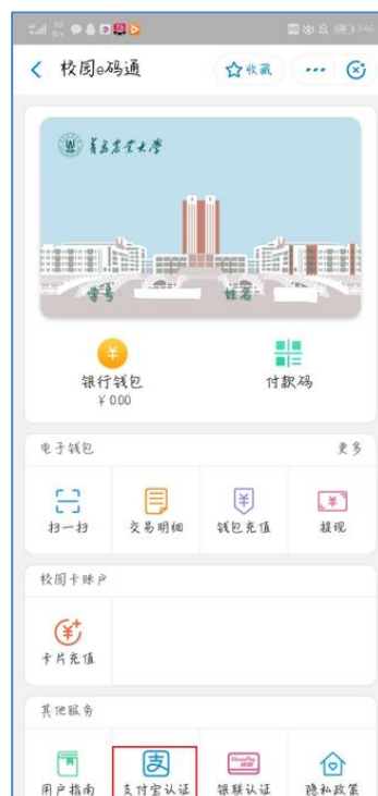
图 10 支付宝绑定