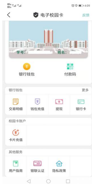
图 3 电子校园卡首页