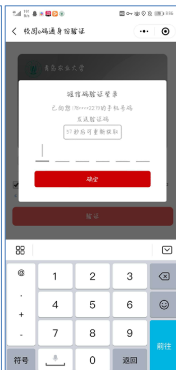
图 9 短信码验