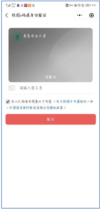
图 5 学工号验证

出现的界面中输入“学工号验证”->“短信码验证”后，进入“校园 e 码通”首页后，点击“微信认证”对用户使用的微信进行关联，直接绑定当前登录的微信号,完成微信认证的功能。