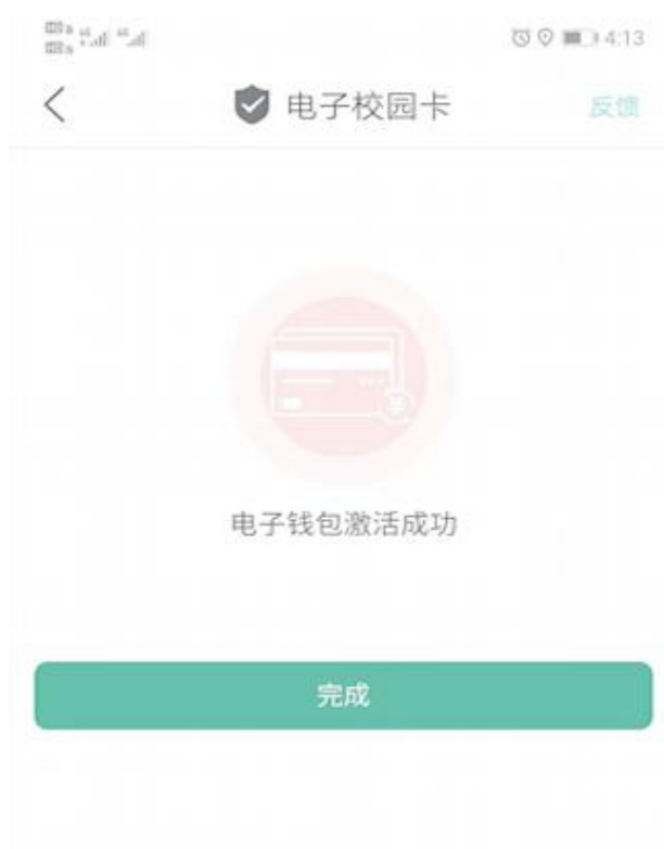
图 4 电子校园卡激活成功

注意：电子校园卡已经激活成功，用户可以点击付款码进行消费，但如果要直接使用微信、支付宝、云闪付，请仔细阅读下面的步骤，完成对微信、支付宝、云闪付的绑定认证才可以。