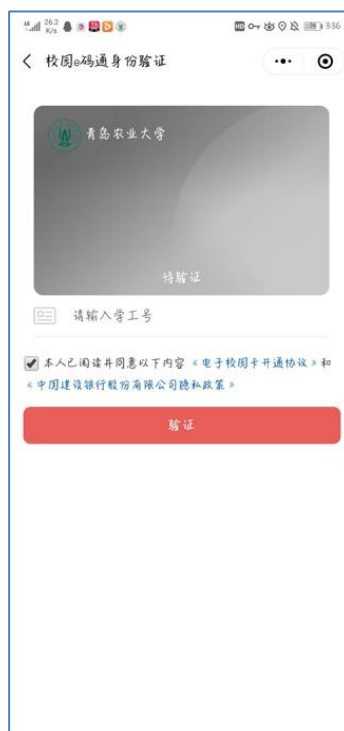
图 8 学工号验证